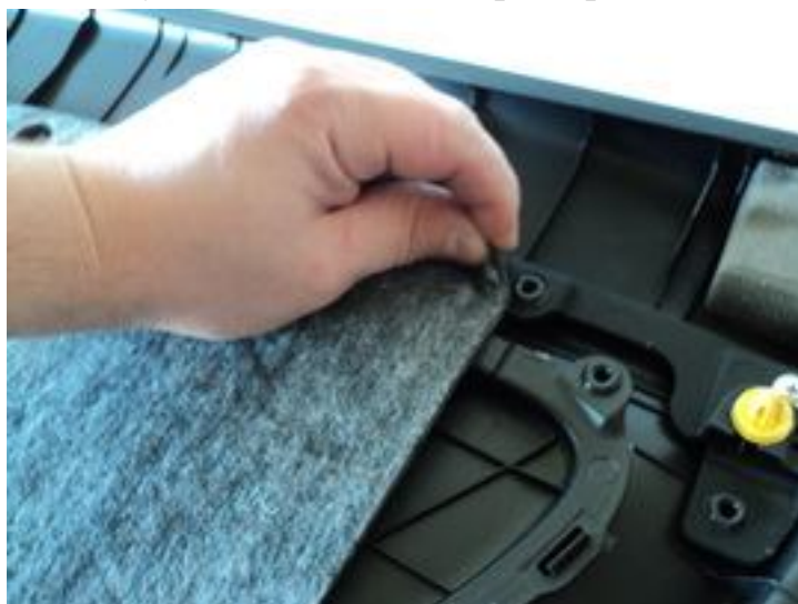
Откручиваем все саморезы

Первоначально снимаем шумоизоляцию, которая приклеена, т.е. аккуратно отрываем ее.