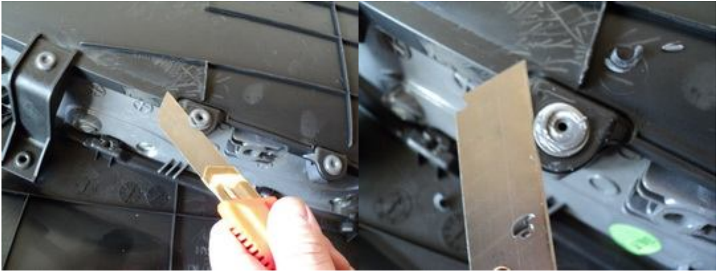
Разбираем все на составные элементы